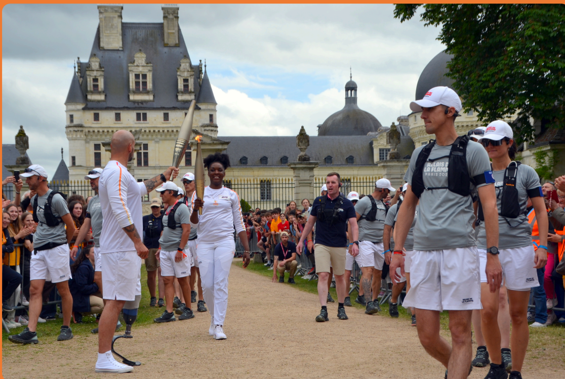
Passage de la Flamme Olympique à Valençay

Du mois de mai au mois d'août, la Flamme Olympique et Paralympique a traversé la France !