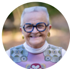
Françoise Gatel Ministre de l'Aménagement du territoire et de la Décentralisation