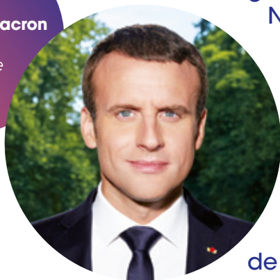
Emmanuel Macron président de la République

“ L’éducation est le premier terrain de cette bataille pour la mobilité géographique et sociale (...).