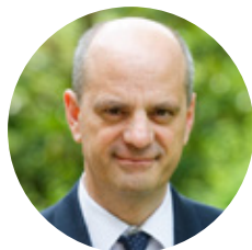
Jean-Michel Blanquer ministre de l'Éducation nationale et de la Jeunesse

80 territoires éligibles ont été sélectionnés à la rentrée de septembre 2019. Nous avons proposé aux collectivités, sans qui rien ne se fera, de s'engager dans cette démarche, au travers de l'élaboration d'une stratégie territoriale ambitieuse et partagée. L'État est là pour les accompagner avec près de 100 millions d'euros engagés sur les trois prochaines années et l'engagement de toute la communauté éducative.