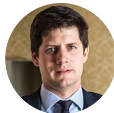
Julien Denormandie ministre auprès de la ministre de la Cohésion des territoires et des Relations avec les collectivités territoriales, chargé de la Ville et du Logement