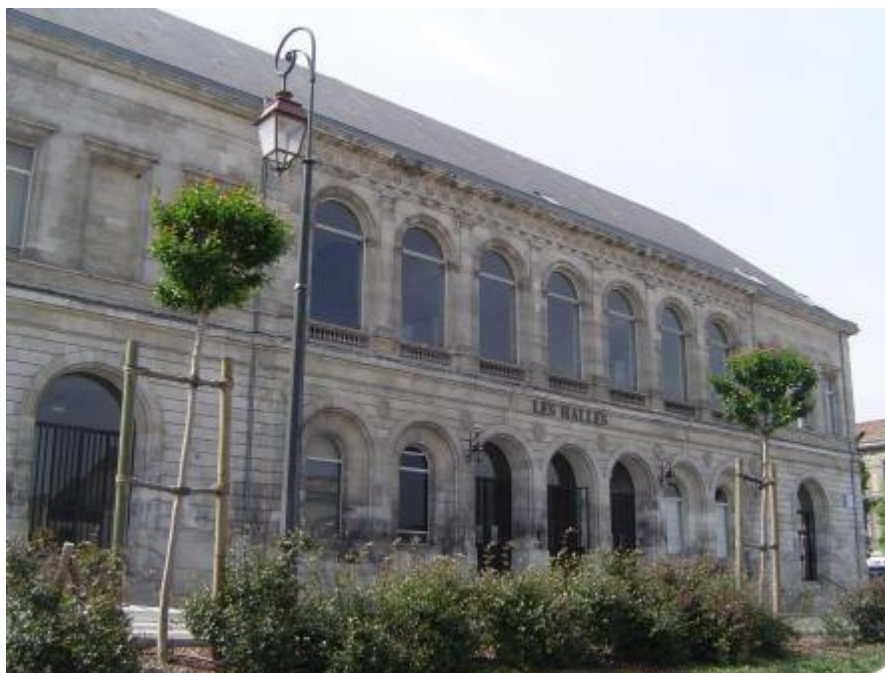
Rochefort – Les Halles - © Libre de droit

Réhabilitation : (re)mettre un édifice aux normes de confort, d'habitabilité, d'hygiène et de sécurité tout en préservant les qualités patrimoniales. La réhabilitation est une intervention plus légère que la restauration et ne touche pas nécessairement toutes les parties de l'édifice (façades par exemple).