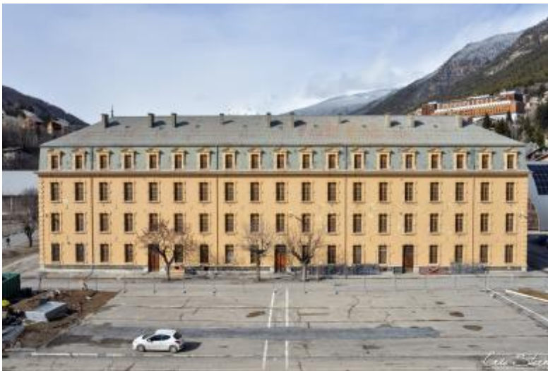
Briançon - Caserne Berwick

Longwy : reconversion du bâtiment de l'ancienne poste de Longwy-Haut, datant du XIXe siècle sur base du XVIe siècle (restauration)