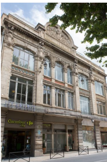
Arles – Nouvelles galeries – © Photo bannière – type paysage

Briançon : reconversion de la caserne Berwick, bâtiment d'hébergement construit au XVIIIe siècle (commerces, services et hôtellerie)