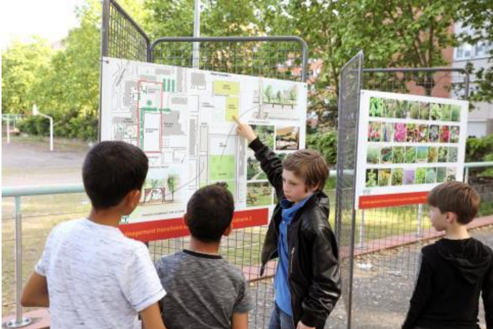
Albi - panneaux d'information

En matière patrimoniale, il est parfois davantage pertinent d'agir non plus à l'échelle de l'immeuble mais à celle d'un ou plusieurs îlots, avec des projets de reconversion et de recyclage urbain. Ce changement d'échelle répond aux enjeux de transition écologique et de sobriété foncière, en même temps qu'il témoigne d'une volonté de réfléchir à la diversité des usages de la ville en s'adaptant aux évolutions des besoins. Cette mutation s'appuie sur des investissements importants qui font appel à des portages fonciers complexes.