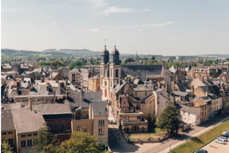
Sedan - Remarkable France

La connaissance du patrimoine constitue un préalable nécessaire à sa mise en valeur auprès des habitants et des touristes. Les patrimoines, contribuant à forger l'identité d'un territoire, constituent un réel atout pour les cœurs de villes ACV.