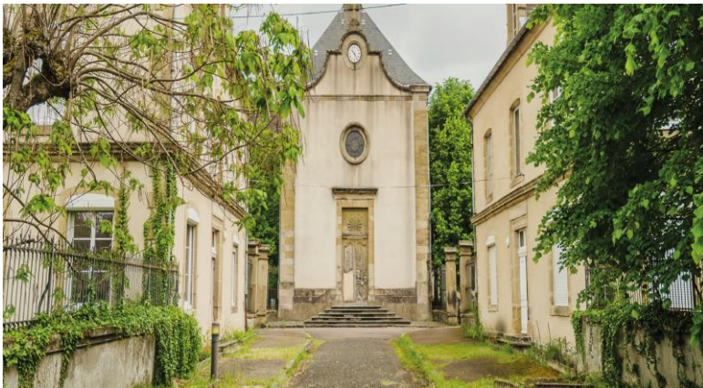
Autun – Hôpital Saint Gabriel

Bourges : restauration du couvent des Augustins (commerce et développement économique, tourisme et patrimoine, événementiel, hébergement)