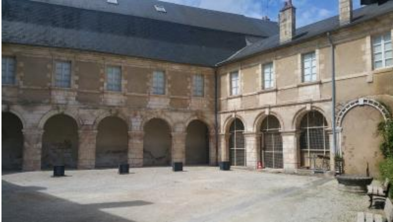
Bourges - Le couvent des Augustins

Bourges : restauration du couvent des Augustins (commerce et développement économique, tourisme et patrimoine, événementiel, hébergement)