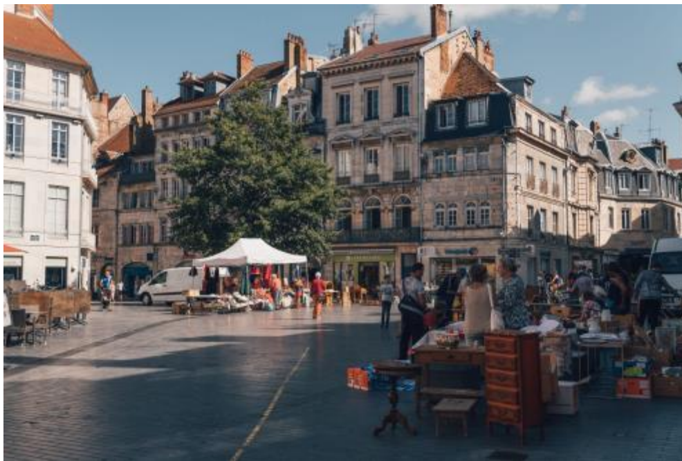
Besançon - Remarkable France

L'habitat est le domaine où se croisent forces et faiblesses des centres anciens. Habiter au cœur de ville donne accès à des services et des commerces de proximité et permet de bénéficier d'un aménagement urbain privilégié.