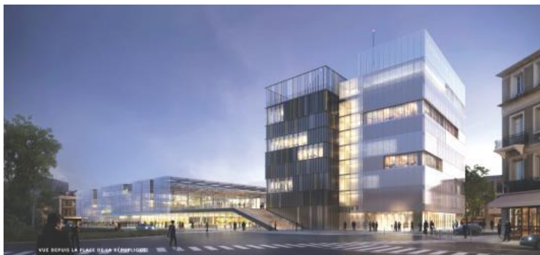
Halle de Pau © Cabinet Ameler et Dubois

Les actions patrimoniales ayant trait au commerce sont de deux ordres. D'une part, les cellules commerciales ou les marchés couverts en cœur de ville présentant des enjeux patrimoniaux font l'objet de réhabilitation ou de valorisation. D'autre part, certaines villes entendent soutenir les activités d'artisanat et d'art dans leurs projets de revitalisation.