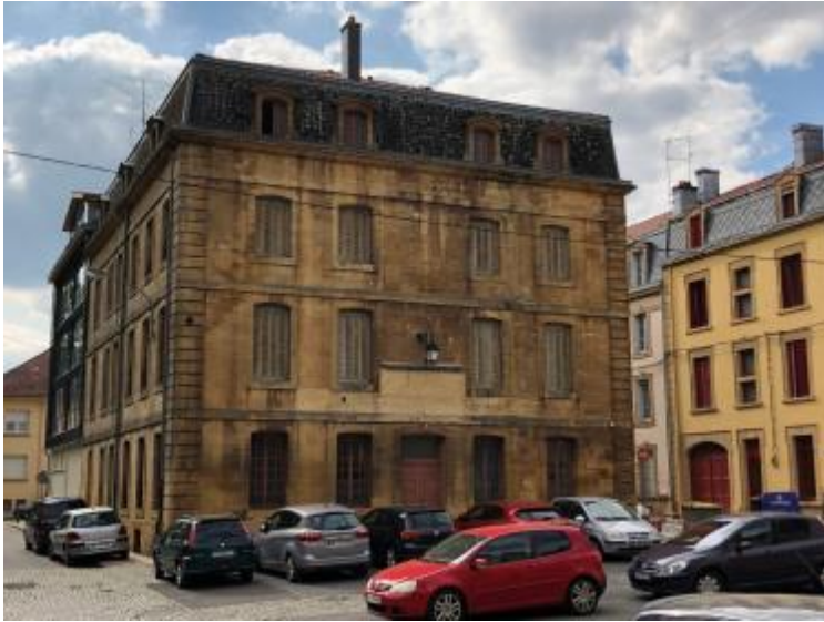
Longwy - Ancienne Poste

Longwy : reconversion du bâtiment de l'ancienne poste de Longwy-Haut, datant du XIXe siècle sur base du XVIe siècle (restauration)