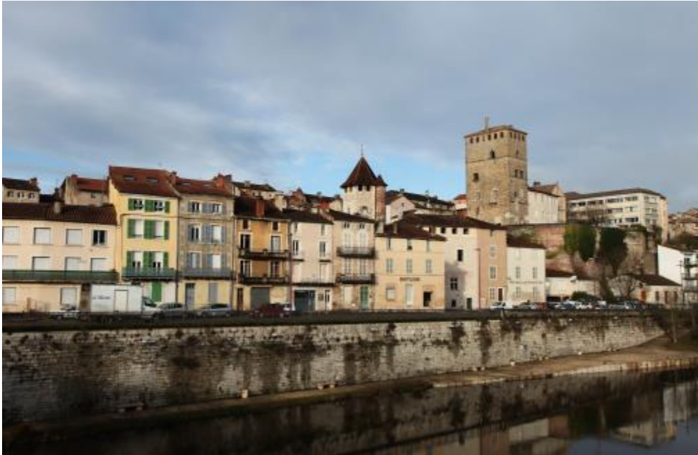
Cahors – Port Bullier

Les espaces publics constituent le support privilégié des actions à caractère patrimonial. L'espace public est conçu comme l'atout premier des cœurs de ville. Offrant une diversité de formes et d'architectures, doté de richesses naturelles et paysagères, il possède une échelle rassurante qui favorise la rencontre, l'échange et permet une identification et une culture communes.