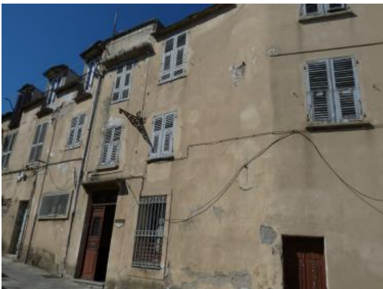
Bastia - Site du Bon-Pasteur

Autun : Le site de renouvellement urbain proposé est l'ancien Hôpital d'Autun Saint Gabriel. Localisé en plein cœur de ville, à proximité de la place centrale, cet ensemble foncier amène à concevoir un projet de restructuration urbaine dans un souci de mixité