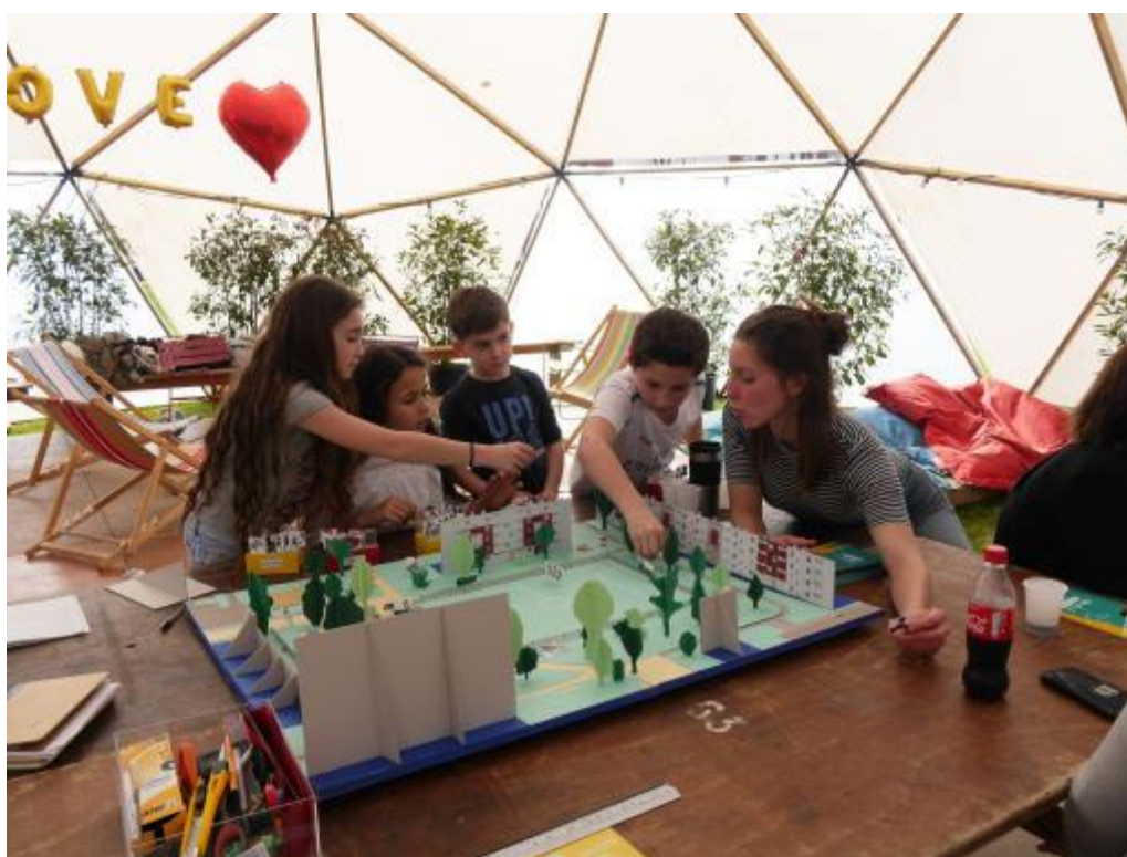
Dax - atelier de concertation avec les enfants

Animation : « donner vie » aux patrimoines. Les actions d'animations consistent à mettre en place des activités de valorisation et de médiation avec comme support les patrimoines.