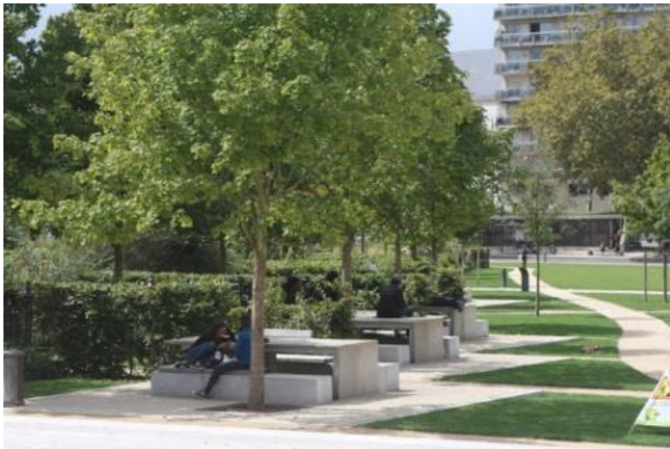
Niort - aménagement de l'espace public

Aménagement urbain : intervention structurante sur une partie d'un cœur de ville, sur des espaces publics, sur des fonctions urbaines (mobilité, économie...).