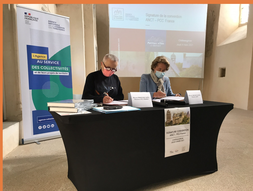
Signature de la première convention de partenariat (35)