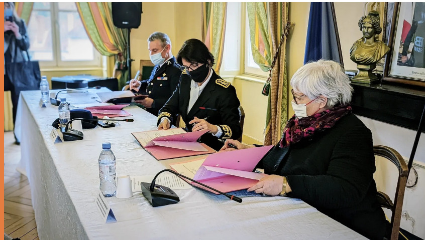
Signature du volet sécurité à Boën-sur-Ligon (42)